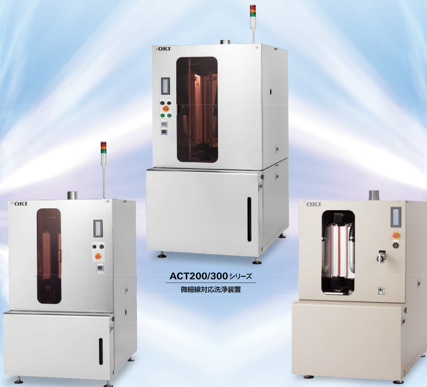
ACT200/300シリーズ 微細線対応洗浄装置